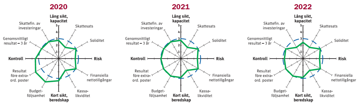
Spindeldiagram: Vänersborgs finansiella profil 2020-2022

Vänersborgs kommun har försämrats jämfört med tidigare år och är sämre än genomsnittet i Sverige. Det är värdena kassalikviditet, skattesats liksom skattefinansiering av investeringar som är sämre än riksnittet. Vänersborgs kommun har valt en modell där betalningsberedskapen delvis säkras upp med en relativt hög avtalad checkkredit, vilket inte fångas upp när kassalikviditeten jämförs med andra kommuner. Vänersborgs kommun har en högre skatt än genomsnittskommunen. Investeringsnivån var den högsta någonsin under 2022 vilket ledde till en kraftigt ökad upplåning.