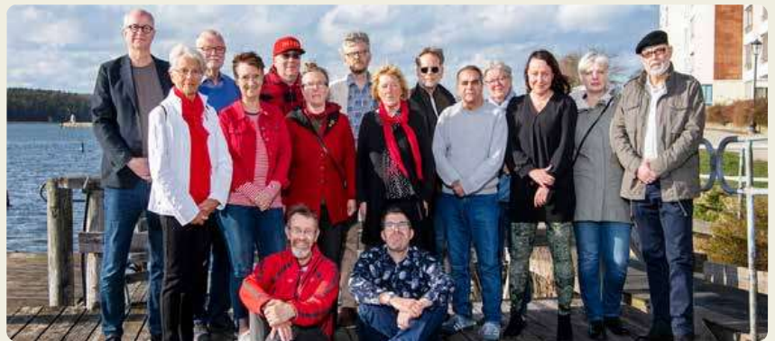
Vänsterpartiets finns för dig. Tillsammans bygger vi ett rättvisare Vänersborg.

Vi står inför ett vägskäl på söndag. Det har varit tydligt under valrörelsen att detta val kommer att påverka vardagen framöver för många människor i hela landet. Sannolikt har du fått ta del av en mängd information och löften från olika partier som vill ha just din röst. Alla partier vill väl det. Men frågorna som skiljer partierna åt är många och viktiga att förstå. Vilken utveckling av samhället vill du se?